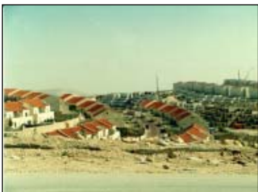
Ma'ale Adumim

Det er vores indtryk, at de sidstnævnte udgør langt det væsentligste problem. Vi besøgte to af slagten, nemlig bosættelsen Ma'ale Adumim, der ligger ca. 8 km øst for Jerusalem og huser 30.000 indbyggere, samt Ariel (18.000 indb.), der ligger ca. 15 km fra 1967-grænsen og fungerer som en forstad til Tel Aviv.