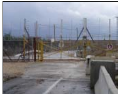
De fleste steder udgøres barrieren af en serie af hegn, patruljeveje og grøfter.

Mens vi ikke mener, at der er grund til at betvivle, at barrieren har vanskeliggjort attentater mod civile, så har den internationale domstol i Haag som bekendt fastslået (9/7 2004), at mens Israel har både ret og pligt til at tage en række forholdsregler for at beskytte sine borgere, så det er i strid med international lov at opføre en sådan barriere på besat område. Domstolen har i overensstemmelse hermed krævet, at de strækninger, der er opført på besat område, skal fjernes.