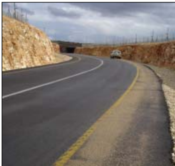
Dele af den ”dobbelt infrastruktur” er allerede realiseret. Denne nyanlagte vej i nærheden af Qalqiliya har til formål at adskille palæstinensisk trafik fra den krydsende bosættervej (se s. 10)

ria” (det hebraiske/bibelske navn for Vestbredden) var besat af Jordan indtil 1967 og at Israels erobring af området i Junikrigen 1967 og efterfølgende oprettelse af bosættelser derfor var/er fuldt berettiget 1 . Endvidere understregede Nachman, at intet privatejet land er blevet konfiskeret fra palæstinensere i forbindelse med oprettelsen og udvidelsen af Ariel, der udelukkende optager land, der af skiftende israelske regeringer er blevet erklæret som ”state land” (se mere herom s. 6). Nachman afviste således blankt idéen om, at bosættelserne skulle udgøre et brud på international lov.