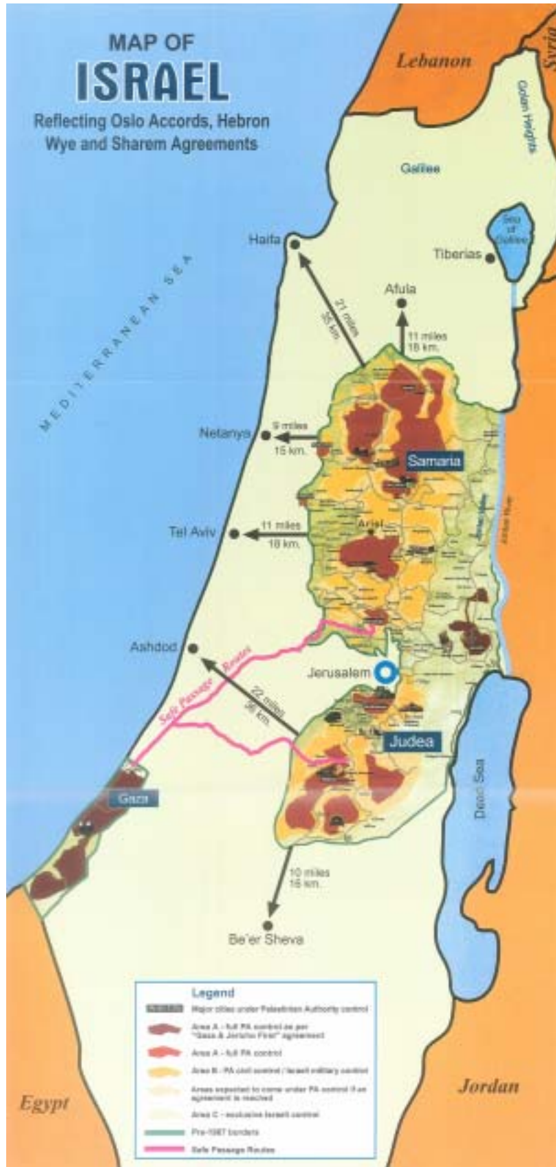
Kort 3: De palæstinensiske selvstyreområder.