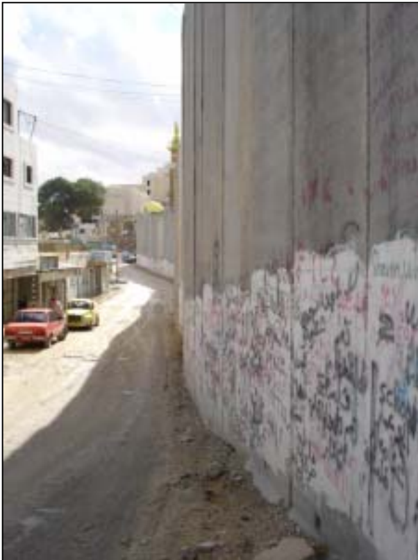
I det palæstinensiske Østjerusalem løber muren gennem tætbeholdt bymæssig bebyggelse.