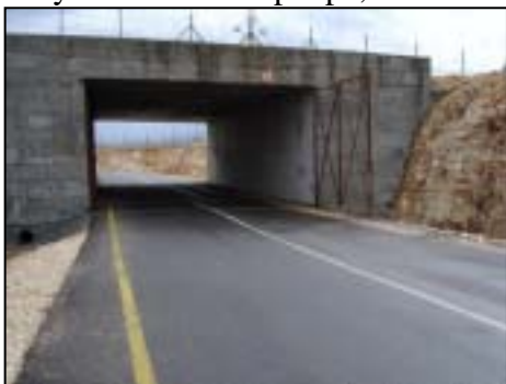
Tunnelen ml. Qalqiliya og Habla

Zahran berettede endvidere, at der netop er bygget en tunnel 7 , der har lettet passagen mellem Qalqiliya og den nærliggende landsby Habla. De to byer var førhen adskilt af barrieren, der her indlemmede bosættelsen Alfe Menashe i Israel på bekostning af kommunikationen mellem Qalqiliya og Habla. Mens tunnelen har lettet transporten mellem Qalqiliya og Habla, har den imidlertid ikke bidraget til at afhjælpe problemet med de lokale landmænds manglende adgang til deres jord. Tunnelen, som vi selv fik lejlighed til at bese, er betalt af Israel, mens den nyanlagte vej, der forbinder Qalqiliya med tunnelen, er betalt af Verdensbanken. Tunnelen udgjorde således et illustrativt og bekymrende eksempel på, hvordan situationen kan tænkes at tage sig ud, hvis den førnævnte plan om en "dobbelt infrastruktur" realiseres i sin fulde udstrækning. Og på Shearers oven for nævnte bemærkning om, at det ikke er en neutral handling at finansiere en vej.